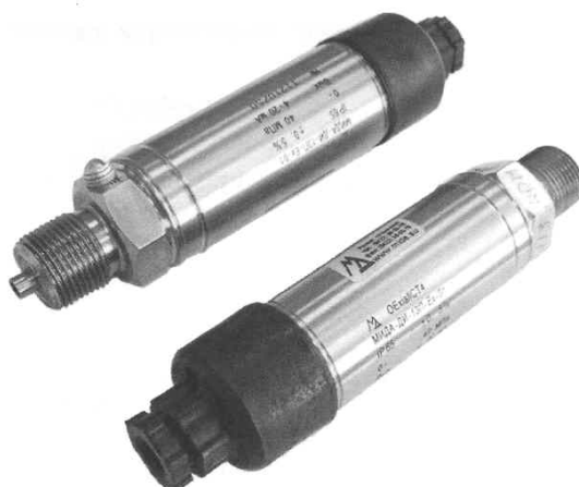
Рисунок 1 - Общий вид датчиков давления МИДА-13П

Пломбирование датчиков давления МИДА-13П не предусмотрено.