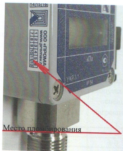
Рисунок 2 - Места пломбирования датчиков