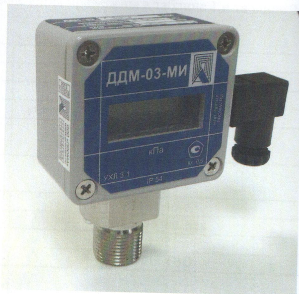
Рисунок 1 - Общий вид датчиков ДДМ-03, ДДМ-03МИ