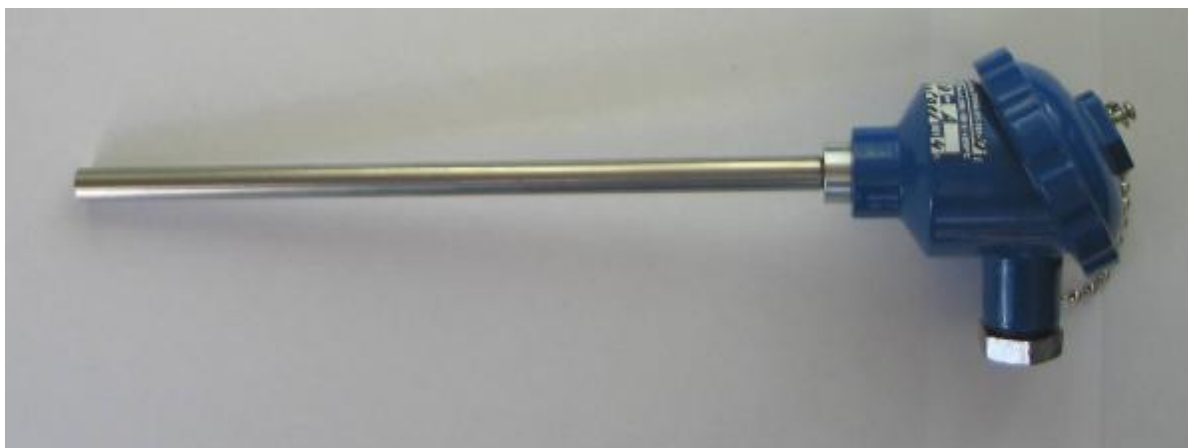
Фото 2. Фотография общего вида термпреобразователя сопротивления ПРОМА-ТС-101-Г