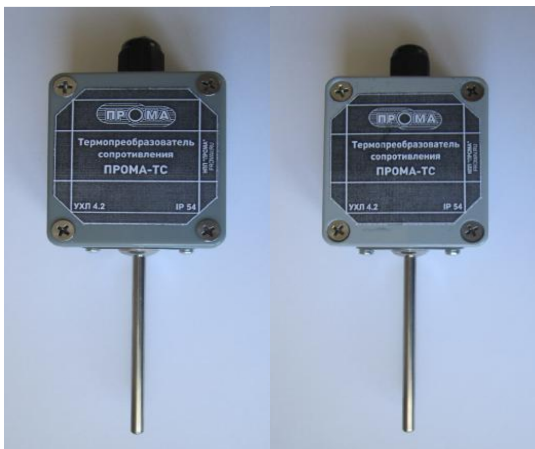
Фото 3. Фотографии общего вида термпреобразователей сопротивления ПРОМА-ТС-102-Г и ПРОМА-ТС-103-Г