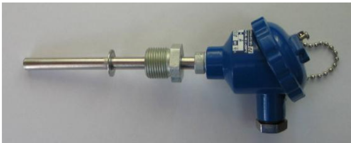
Фото1 .Фотография общего вида термопреобразователя сопротивления ПРОМА-ТС-101-Р

Способы крепления термопреобразователей сопротивления ПРОМА-ТС-101: штуцер М20х1,5; подвижный штуцер М20х1,5; свободная установка в гнездо или гильзу; ПРОМА-ТС-102 и ПРОМА-ТС-103 – свободная установка в гнездо, гильзу или монтаж на кронштейне.